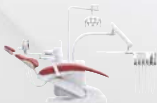
KaVo uniQa T

Lieferumfang gemäß Aktionsbeschreibung – ohne optionale/ aufpreispflichtige Ausstattungen wie Arbeitsstühle, Patienten-kommunikation CONEXIOcom Vision, CONECTbase Vision und RELAXline Softpolster. Abbildung kann weitere optional erhältliche Ausstattungen enthalten. Details und Preise zu abgebildeten oder weiteren Ausstattungsvarianten nennt Ihnen gerne Ihr Dental-Union Fachhandelspartner.