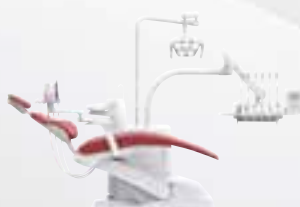
KaVo uniQa S