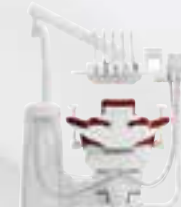
Rechts- Links Version Assistenzelement

Fragen Sie Ihren Dental-Union Fachhandelspartner nach möglichen weiteren KaVo Frühbuchervorteilen vor der IDS KAVO