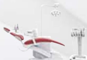
KaVo uniQa C